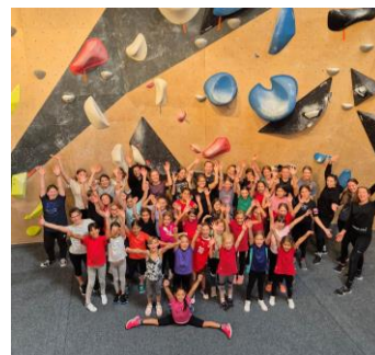
Boulder-Luft in Basel schnuppern auf der MR-Reise

Gerade mal zwei Wochen später, vom 14. Bis 15. September, erwartete uns ein weiteres Highlight im Mädchenriegenjahr: wir gingen auf die alle zwei Jahre stattfindende Mädchenriegenreise! In Basel jagten wir den Lächerli-Dieb, besuchten den Tierpark und lernten die Sportart Bouldern kennen.