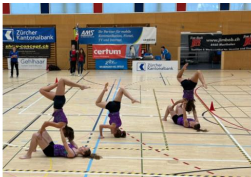
Schlusspose unseres Gymnastik-Teams an der KMS

Ende Oktober organisierte der DTV die kantonalen Meisterschaften Jugend. Beim Heimwettkampf zeigte unser Gymnastik-Team zum letzten Mal ihre Übung. Mit einem gelungenen Durchgang erturnten sie den guten 5. Rang.